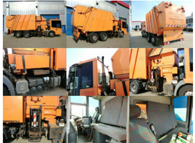
Mercedes-Benz Econic 2628L 6x2 mit SIDEPRESS Aufbau Econic 2628L 6x2 mit SIDEPRESS Aufbau

Preis (brutto): 9.401,00 € Gesetzl. MwSt. 19%: 1.501,00 €