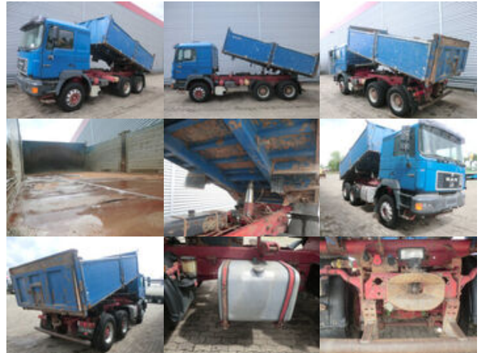
MAN T39 26.403 6x4 T39 26.403 6x4

Engine repaired for approx. EUR 10,000, new pistons