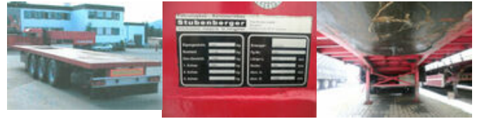
TONHOFER SAH DL 1 TONHOFER DL1 Plattform-Auflieger

Preis (brutto): 4.641,00 € Gesetzl. MwSt. 19%: 741,00 €