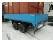
GOEBEL & SOHN TA 8 GOEBEL & SOHN TA8

Preis (brutto): 3.451,00 € Gesetzl. MwSt. 19%: 551,00 €