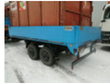
GOEBEL & SOHN TA 8 GOEBEL & SOHN TA8

Preis (brutto): 3.451,00 € Gesetzl. MwSt. 19%: 551,00 €