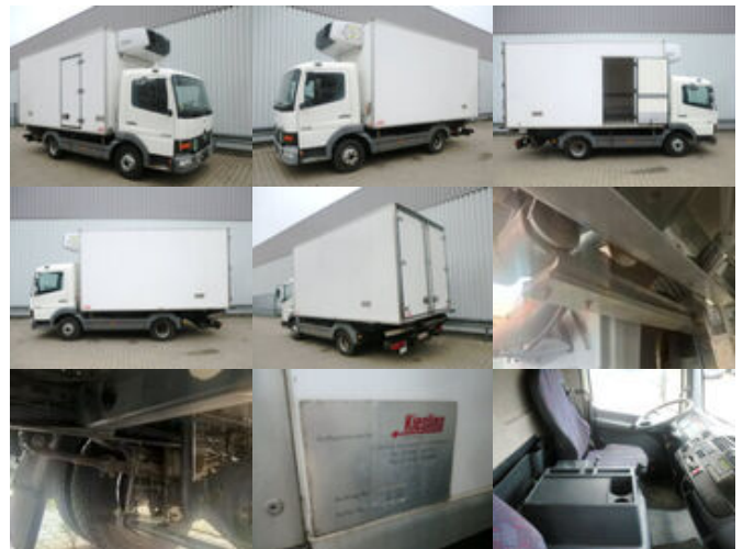
Mercedes-Benz Atego 815 4x2