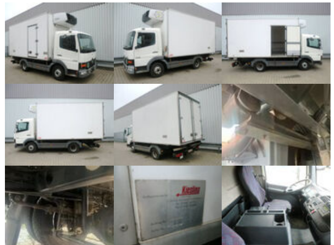
Mercedes-Benz Atego 815 4x2

Preis (brutto): 11.781,00 € Gesetzl. MwSt. 19%: 1.881,00 €