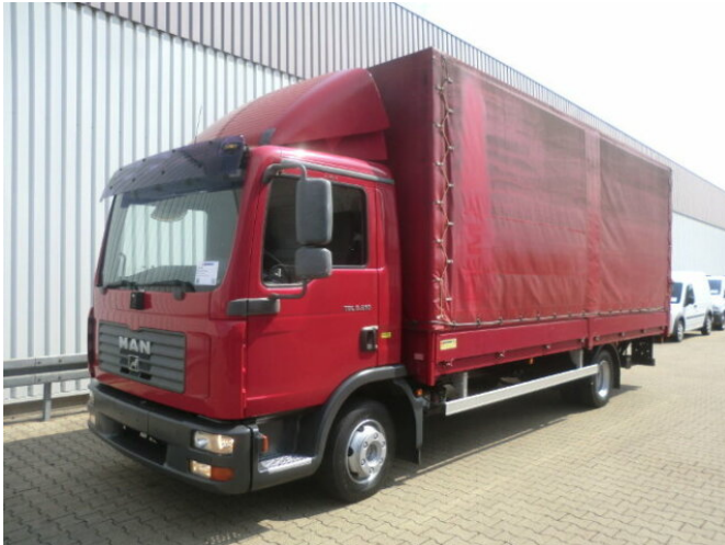
MAN TGL 8.210 BL 4x2