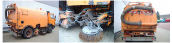
Mercedes-Benz L 1314KO 4x2