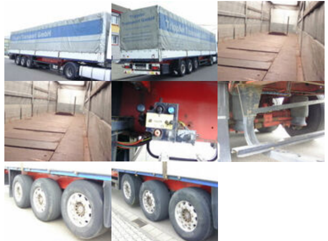
Schmitz S 01

Preis (brutto): 5.355,00 € Gesetzl. MwSt. 19%: 855,00 €