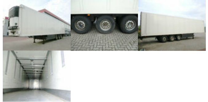
Schmitz SKO 24

Preis (brutto): 9.401,00 € Gesetzl. MwSt. 19%: 1.501,00 €