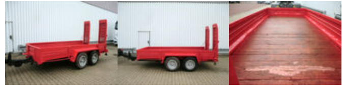
Fuchs TP 4000 FUCHS, HEINRICH TG 4000

Preis (brutto): 3.451,00 € Gesetzl. MwSt. 19%: 551,00 €