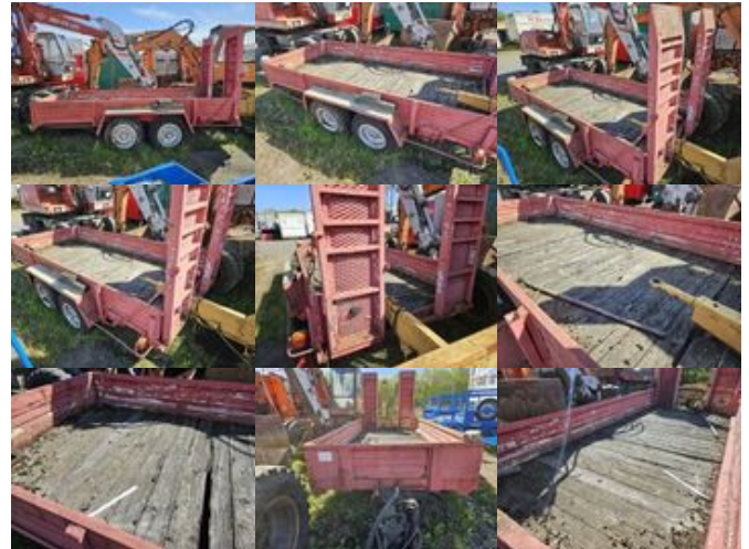
Fuchs TP 4000 FUCHS, HEINRICH TG 4000

Preis (brutto): 3.451,00 € Gesetzl. MwSt. 19%: 551,00 €