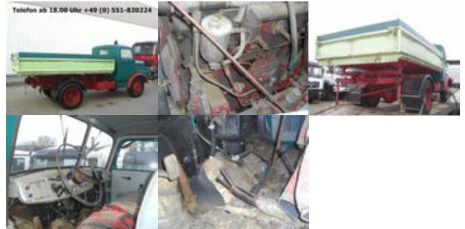
IFA-AUTOMOBILW. - H3A 4x2 IFA H3A 4x2

Preis: 9.000,00 € MwSt. nicht ausweisbar