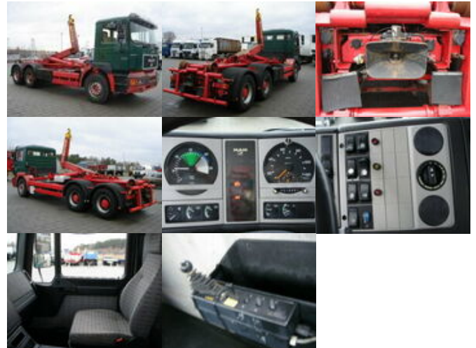
MAN E69 26.403 26.403 6x2, Marrell 26.70, AHK

Preis (brutto): 14.161,00 € Gesetzl. MwSt. 19%: 2.261,00 €