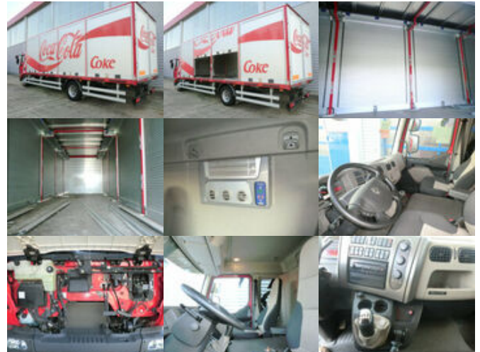
Renault Midlum 220 DXi 4x2 Midlum 220 DXi 4x2Getränkekoffer TÜV:2019