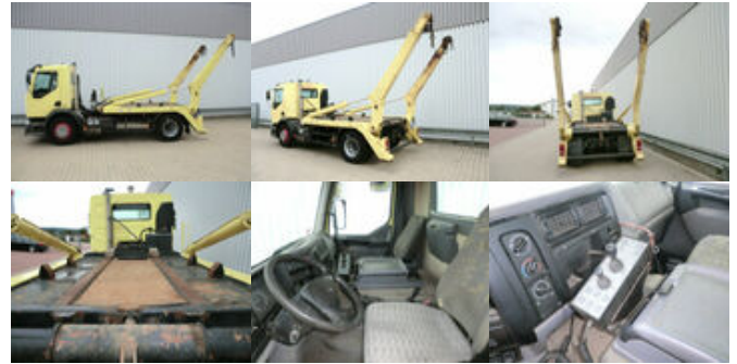
Renault Premium 250 4x2