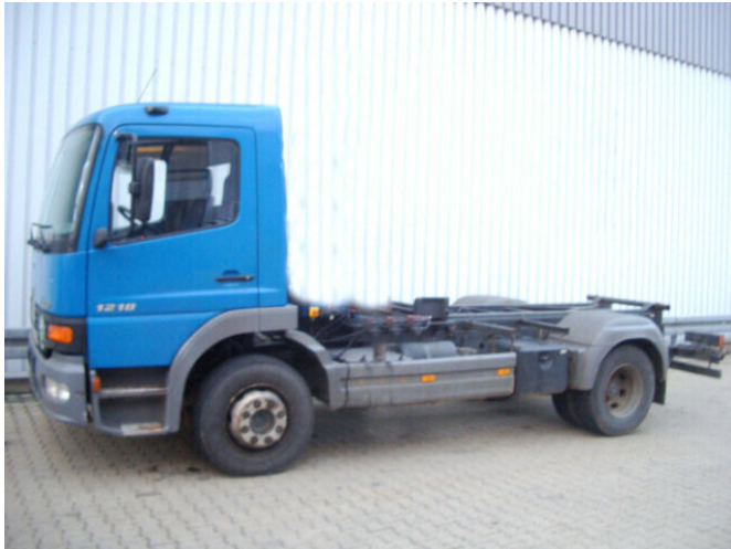
Mercedes-Benz Atego 1218 4x2

Preis (brutto): 10.710,00 € Gesetzl. MwSt. 19%: 1.710,00 €