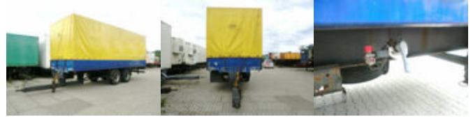
Zanner TPA 18 Zanner TPA 18