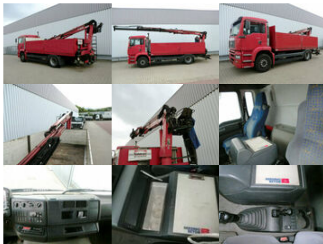
MAN TGA 18.360 4x2 TGA 18.360 4x2, Baustoff, Kran ATLAS 125.1

Preis (brutto): 20.111,00 € Gesetzl. MwSt. 19%: 3.211,00 €