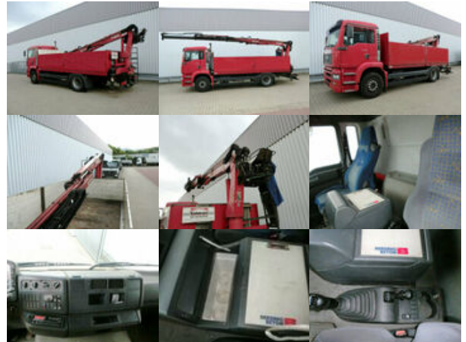
MAN TGA 18.360 4x2 TGA 18.360 4x2, Baustoff, Kran ATLAS 125.1