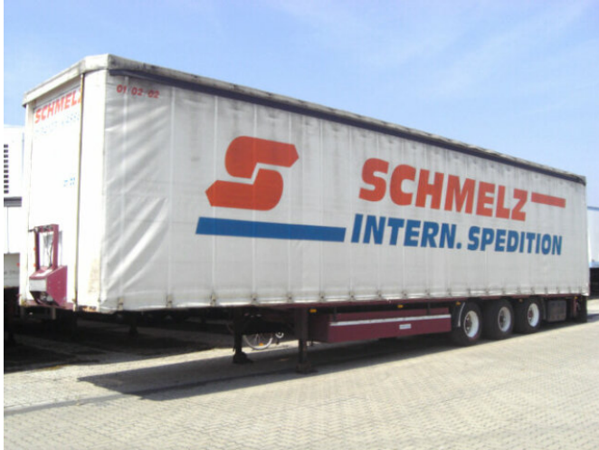
Meusbürger SANh MPS-3 MEUSBURGER MPS-3, Mega, Jumbo

Preis (brutto): 3.451,00 € Gesetzl. MwSt. 19%: 551,00 €