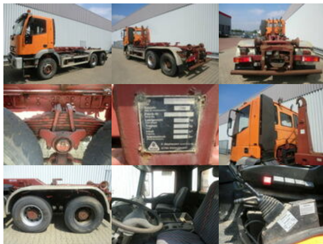
Iveco Trakker 320 E34 6x460EH 34 6x4 Trakker 320 E34 6x460EH 34 6x4, Ersatzteilträger

Preis (brutto): 16.541,00 € Gesetzl. MwSt. 19%: 2.641,00 €