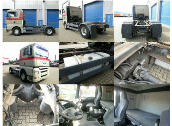
MAN TGA 18.360 4x2

Preis (brutto): 9.401,00 € Gesetzl. MwSt. 19%: 1.501,00 €