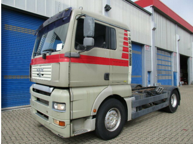
MAN TGA 18.360 4x2