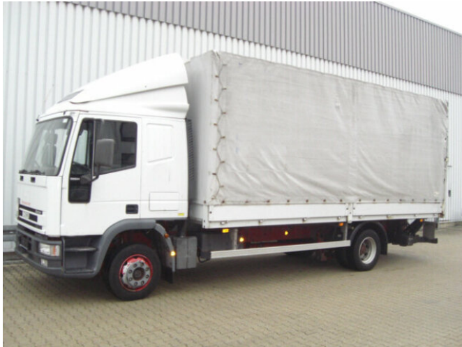
Iveco EuroCargo 120E24 4x2