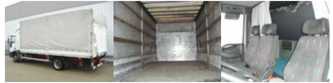
Iveco EuroCargo 120E24 4x2