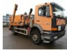
Mercedes-Benz Atego 1828 K 4x2 Atego 1828 K 4x2