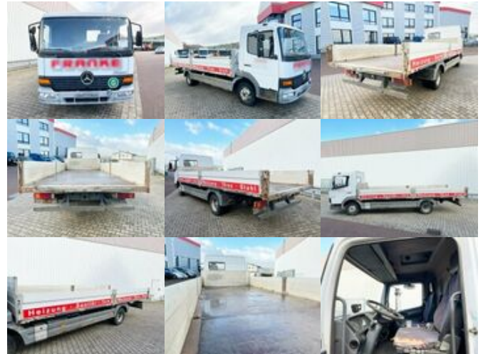
Mercedes-Benz Atego 818 4x2 Atego 818 4x2

Preis (brutto): 7.021,00 € Gesetzl. MwSt. 19%: 1.121,00 €