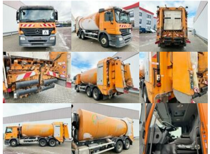
Mercedes-Benz Actros 2632/41 6x4 Actros 2632/41 6x4, FAUN Rotopress 520, Zöller-Schüttung

Preis (brutto): 35.581,00 € Gesetzl. MwSt. 19%: 5.681,00 €