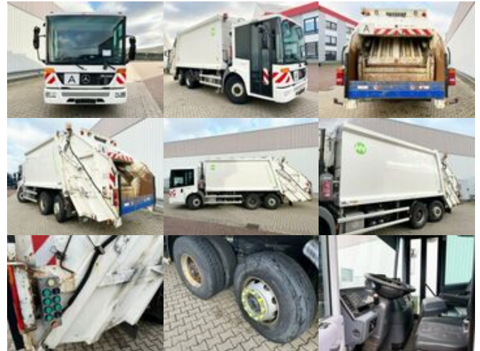
Mercedes-Benz Econic 2633 L/NLA 6x2/4 Econic 2633 L/NLA 6x2/4, Lenkachse, Sperrmüllwagen ca. 23,9m 3

Preis (brutto): 17.731,00 € Gesetzl. MwSt. 19%: 2.831,00 €