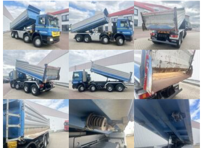
Mercedes-Benz Actros MP 3, 3241/8x4, Actros MP 3, 3241/8x4, Alukipper Bordmatik, Kli-Ret