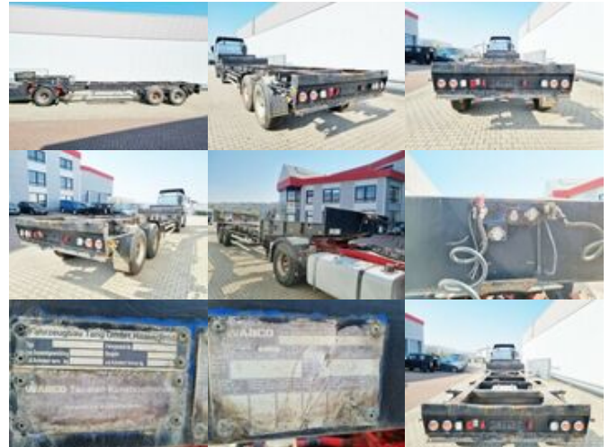
Tang Pritschenaufliieger TANG Pritschenaufliieger

Preis (brutto): 4.641,00 € Gesetzl. MwSt. 19%: 741,00 €