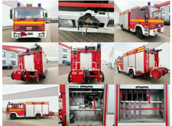
Iveco FF 150 E 27 4x2 FF 150 E 27 4x2 Doka, Euro Fire, TLF, Feuerwehr, Seilwinde

Preis: 19.900,00 € MwSt. nicht ausweisbar