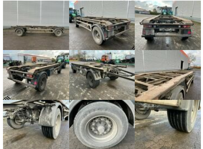
Müller-Mitteltal RA 18 RA 18 Abrollanhänger

Preis (brutto): 4.641,00 € Gesetzl. MwSt. 19%: 741,00 €