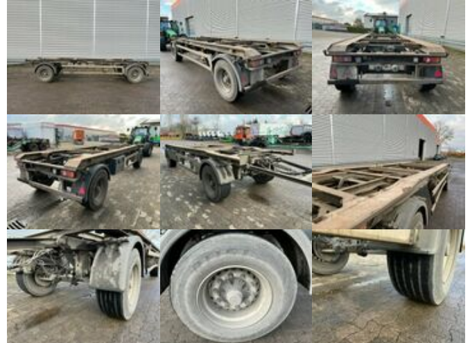
Müller-Mitteltal RA 18 RA 18 Abrollanhänger

Preis (brutto): 4.641,00 € Gesetzl. MwSt. 19%: 741,00 €