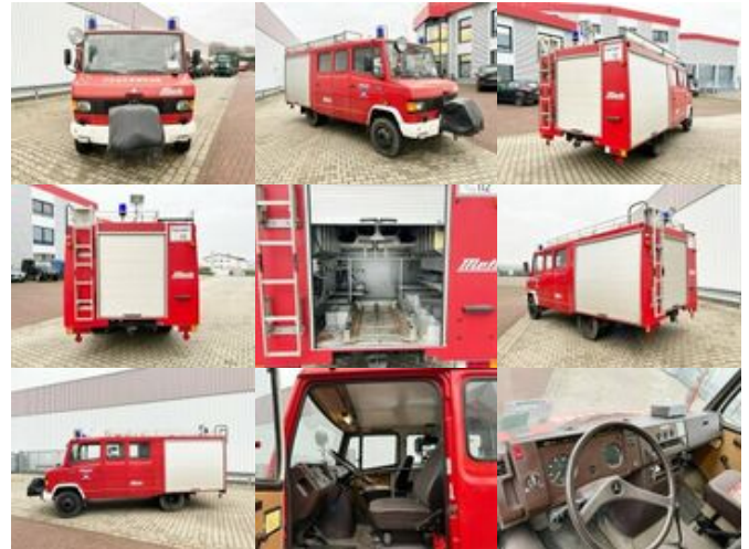
Mercedes-Benz 709 D 4x2 Doka 709 D 4x2 Doka, LF 8

Preis: 9.900,00 € MwSt. nicht ausweisbar