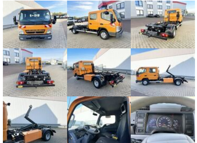
Mitsubishi Canter Fuso 6C15D 4x2 Doka Canter Fuso 6C15D 4x2 Doka, City-Abroller

Preis (brutto): 28.441,00 € Gesetzl. MwSt. 19%: 4.541,00 €