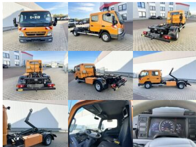
Mitsubishi Canter Fuso 6C15D 4x2 Doka Canter Fuso 6C15D 4x2 Doka, City-Abroller

Preis (brutto): 26.775,00 € Gesetzl. MwSt. 19%: 4.275,00 €