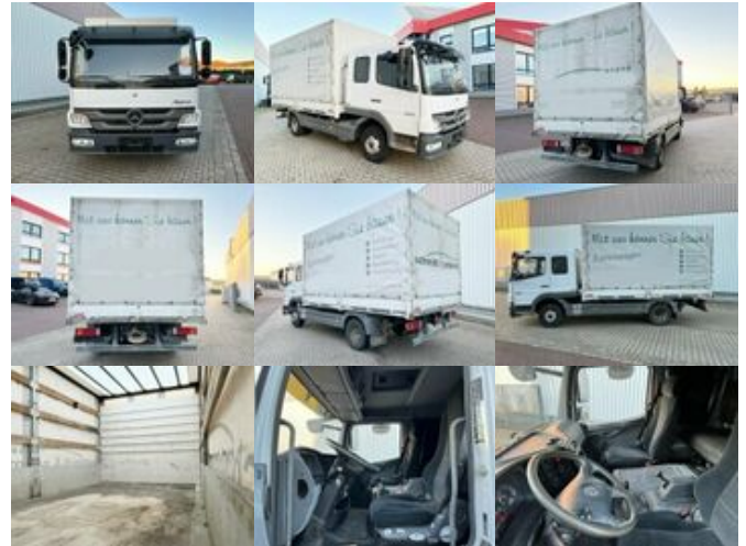
Mercedes-Benz Atego 822 4x2 Atego 822 4x2, Doka mit Kombisitzbank

Preis (brutto): 23.681,00 € Gesetzl. MwSt. 19%: 3.781,00 €