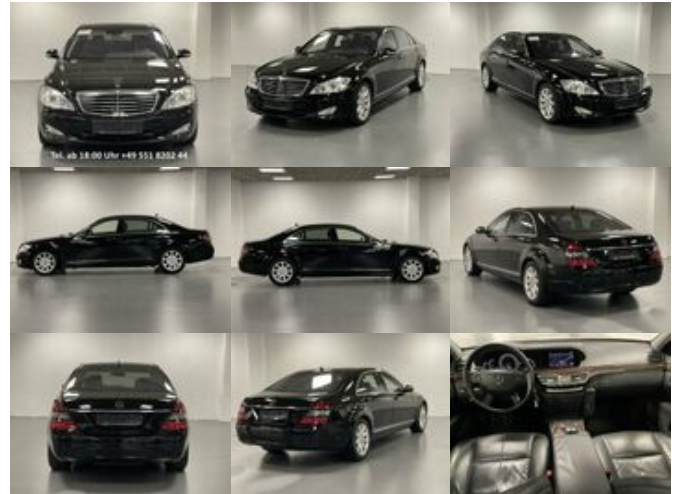
Mercedes-Benz S 420 L CDI Limousine BKA Ausstattung 420 L CDI Limousine BKA Ausstattung

Preis: 27.000,00 € MwSt. nicht ausweisbar