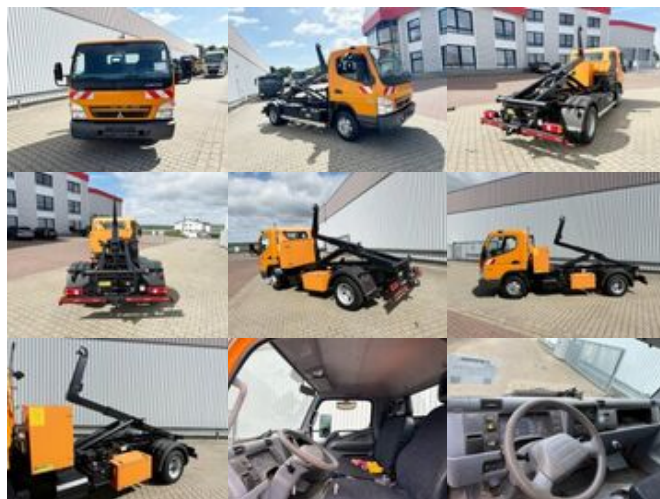
Mitsubishi Canter Fuso 7C15D 4x2, City-Abroller

Preis (brutto): 32.011,00 € Gesetzl. MwSt. 19%: 5.111,00 €