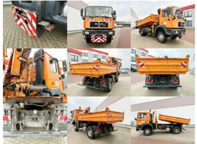
MAN 19.293 4x4 BL 19.293 4x4 BL mit Kran Meiller MK77RS2

Preis (brutto): 35.581,00 € Gesetzl. MwSt. 19%: 5.681,00 €