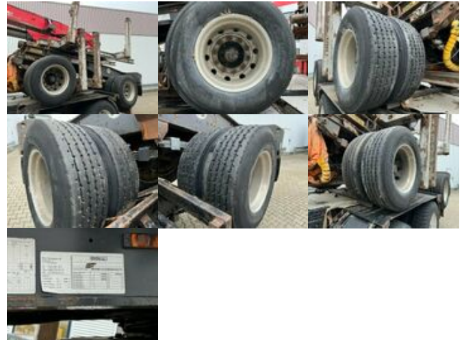
Doll M134 Nachläufer M134 Nachläufer

Preis (brutto): 14.161,00 € Gesetzl. MwSt. 19%: 2.261,00 €