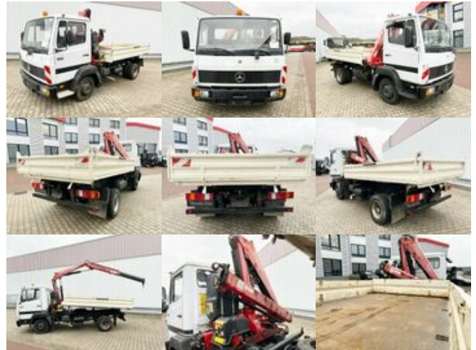
Mercedes-Benz 811 K 4x2 811 K 4x2 mit Kran Fassi F65A.21 (BJ.2009)

Preis (brutto): 17.731,00 € Gesetzl. MwSt. 19%: 2.831,00 €