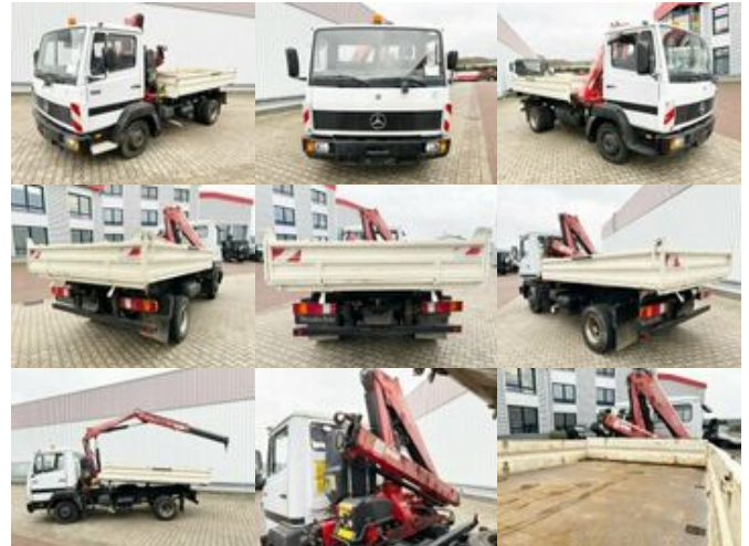
Mercedes-Benz 811 K 4x2 811 K 4x2 mit Kran Fassi F65A.21 (BJ.2009)

Preis (brutto): 17.731,00 € Gesetzl. MwSt. 19%: 2.831,00 €