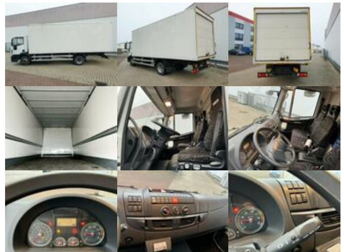
Iveco EuroCargo ML140E28 4x2 EuroCargo ML140E28 4x2, 41 cbm

Preis (brutto): 32.011,00 € Gesetzl. MwSt. 19%: 5.111,00 €