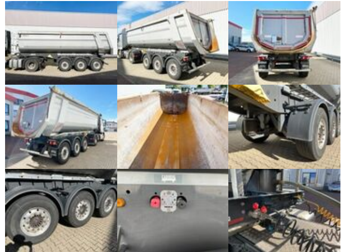
Carnehl CHKS34/HS CHKS34/HS, Stahlmulde ca. 29m³, HARDOX, Liftachse, Schütte

Preis (brutto): 26.061,00 € Gesetzl. MwSt. 19%: 4.161,00 €