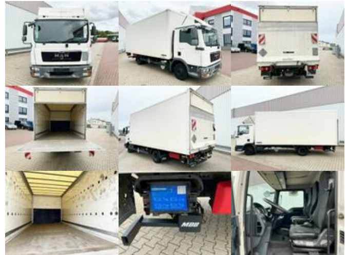
MAN TGL 8.180 4x2 BL TGL 8.180 4x2 BL mit MBB LBW

Preis (brutto): 9.401,00 € Gesetzl. MwSt. 19%: 1.501,00 €