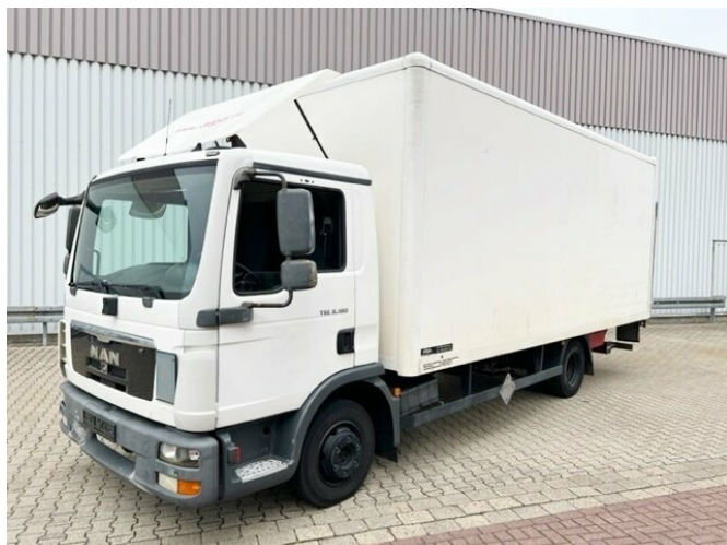
MAN TGL 8.180 4x2 BL TGL 8.180 4x2 BL mit MBB LBW