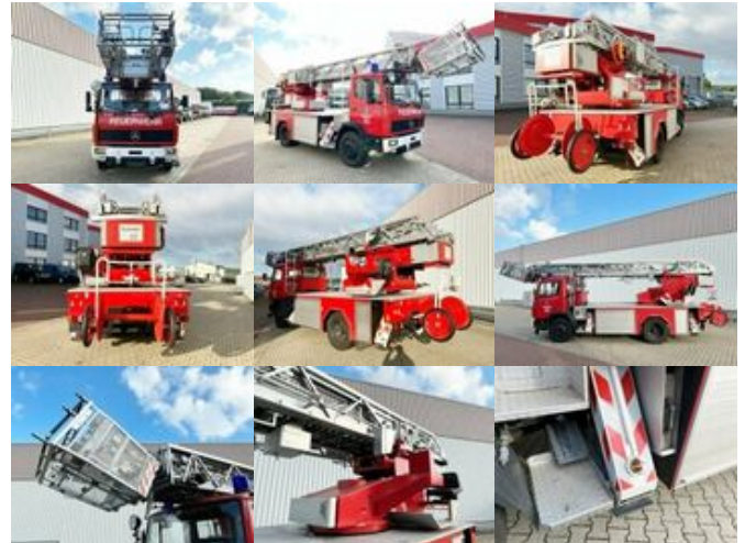
Mercedes-Benz 1120 F 4x2 1120 F 4x2, DLK 18-12, Metz Drehleiter, 18m

Preis: 17.900,00 € MwSt. nicht ausweisbar