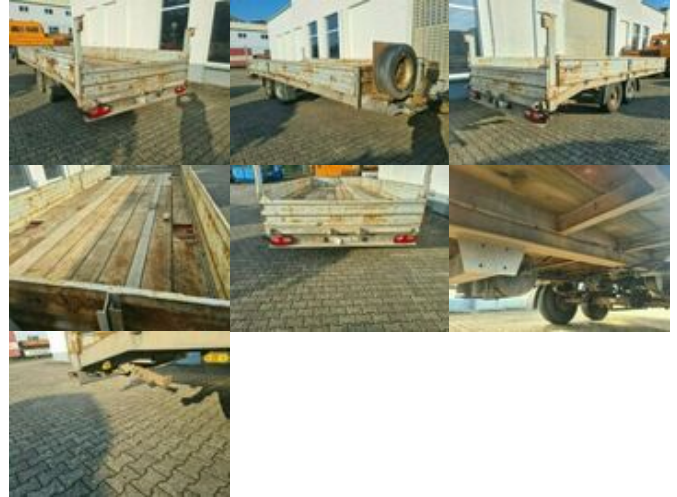
MOESLEIN Möslein Tandem TT 105 Möslein Tandemtieflader TT 105

Preis (brutto): 9.401,00 € Gesetzl. MwSt. 19%: 1.501,00 €