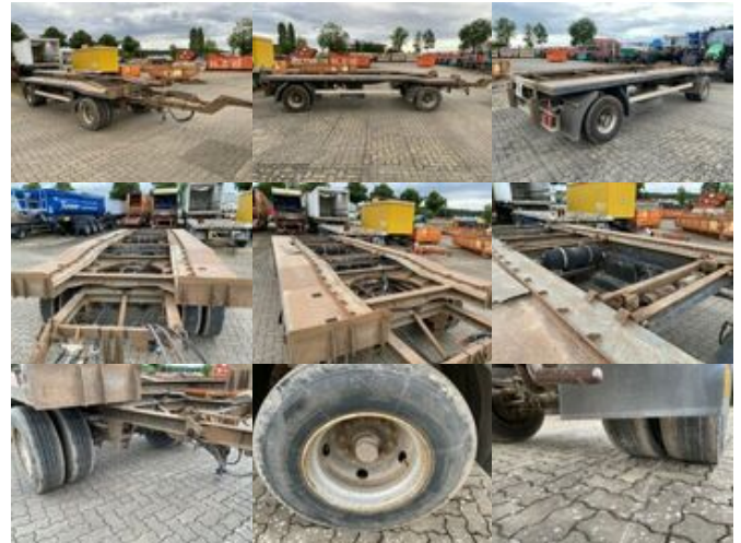
Schmidt FT 18/Z/5,4 Abrollanhänger FT 18/Z/5,4 Abrollanhänger

Preis (brutto): 3.451,00 € Gesetzl. MwSt. 19%: 551,00 €