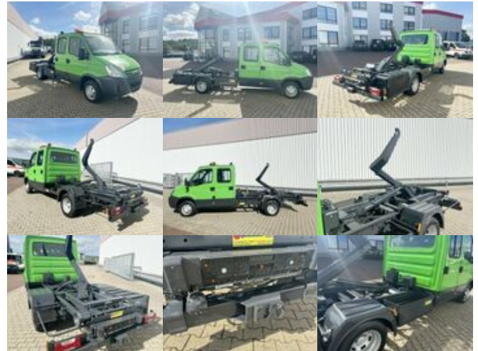
Iveco Daily 45C15D 4x2 Doka Daily 45C15D 4x2 Doka, City-Abroller

Preis (brutto): 20.111,00 € Gesetzl. MwSt. 19%: 3.211,00 €