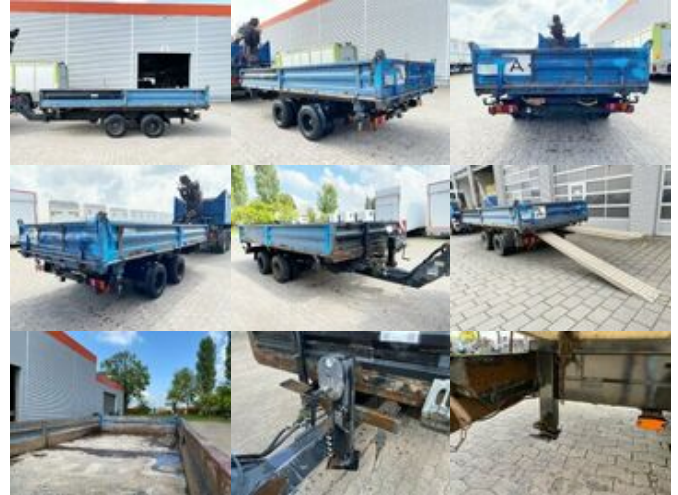
Blumenröhr Kippanhänger Kippanhänger

Preis (brutto): 13.685,00 € Gesetzl. MwSt. 19%: 2.185,00 €