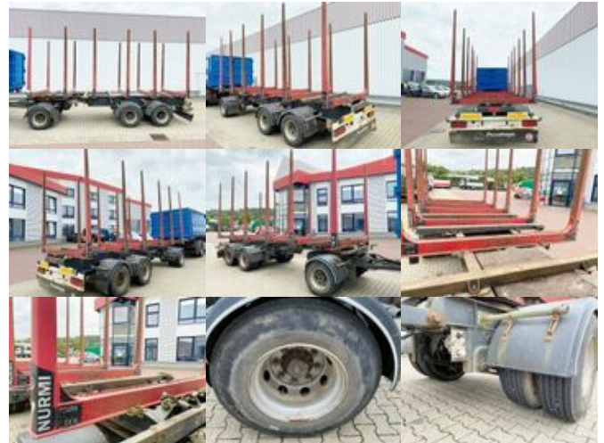
- ZASLAW D-36657 Holzanhänger ZASLAW D-36657 Holzanhänger

Preis (brutto): 14.161,00 € Gesetzl. MwSt. 19%: 2.261,00 €