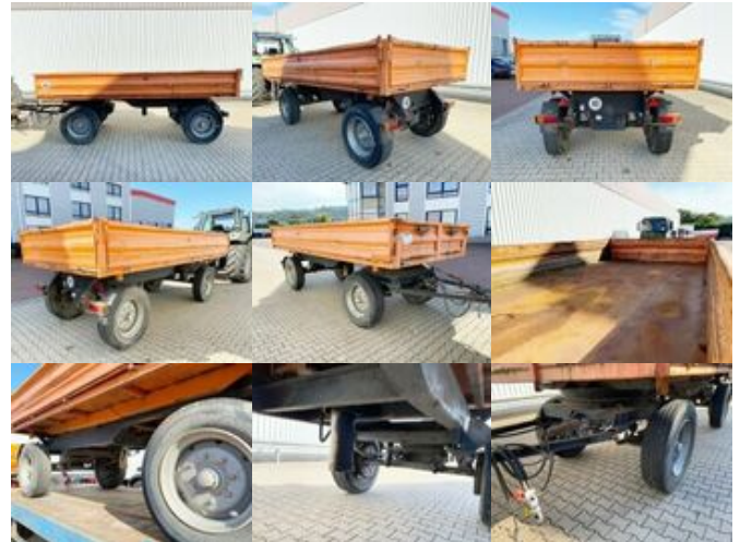
Müller-Mitteltal KDU 11,0 KDU 11,0, Ex-Stadtverwaltung

Preis (brutto): 5.831,00 € Gesetzl. MwSt. 19%: 931,00 €