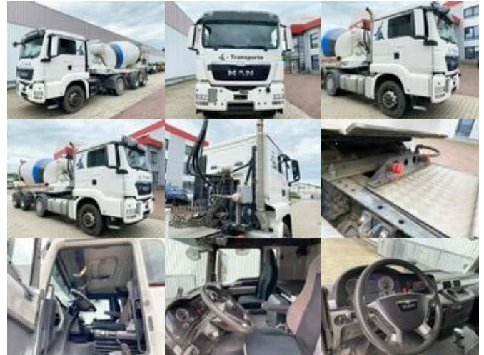
MAN TGS 18.400 4x4H BLS TGS 18.400 4x4H BLS, HydroDrive, Motorantrieb

Preis (brutto): 29.631,00 € Gesetzl. MwSt. 19%: 4.731,00 €