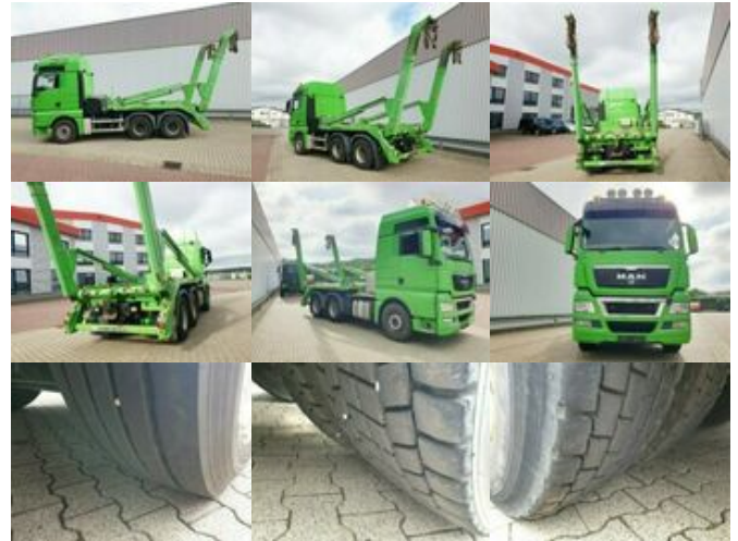
MAN TGX 26.540 6x4 BB TGX 26.540 6x4 BB, Intarder, XXL-Fahrerhaus

Preis (brutto): 35.581,00 € Gesetzl. MwSt. 19%: 5.681,00 €