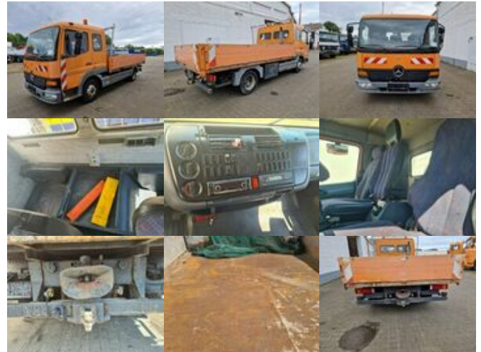
Mercedes-Benz Atego 815 4x2 Atego 815 4x2, 2x AHK